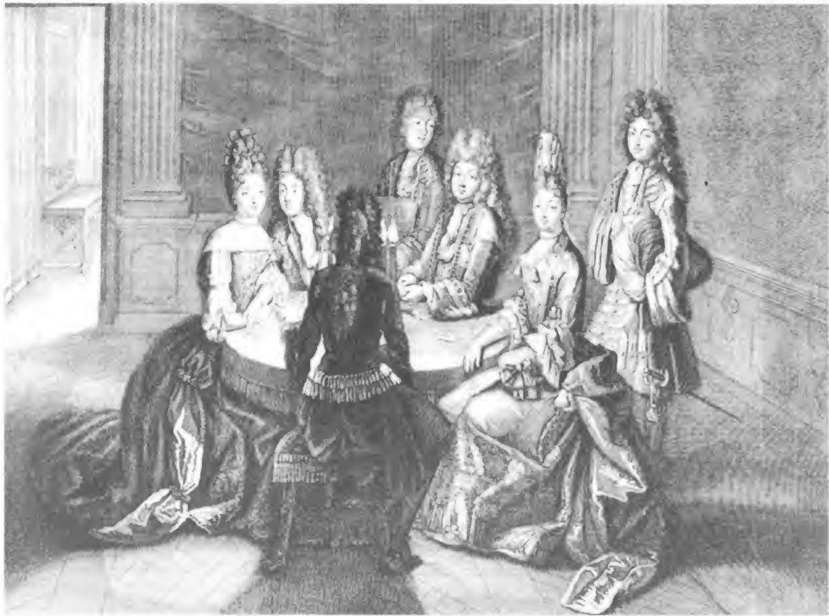
Habitación de juegos de la familia real en Versalles hacia 1694 (por Trouvain, gabinete de estampas de la Biblioteca Nacional, París)

dos vecinos (...) es necesario aumentar el dinero en el comercio público, obteniéndolo de los países de donde proviene, conservándolo en el interior del reino, impidiendo que salga y ofreciendo medios a los hombres para que saquen de él un provecho (...) sólo el comercio y todo lo que de él depende puede producir este gran efecto.